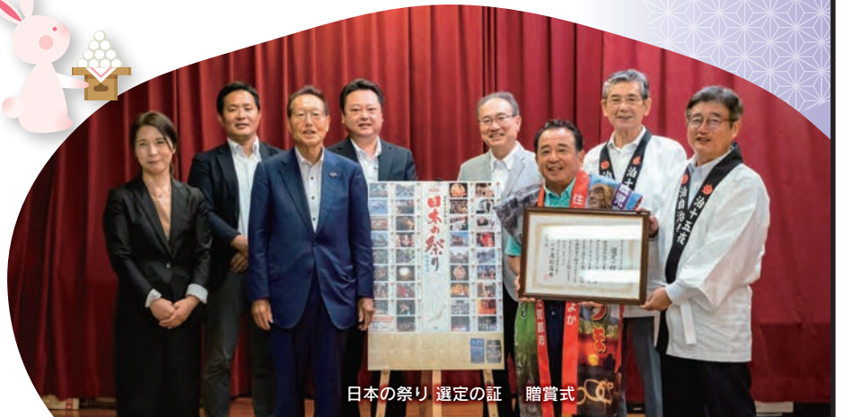
日本の祭り 選定の証 贈賞式