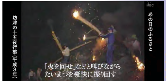
▲あの日のふるさと 上之坊集落に伝わる火とぼし(平成3年)

9月30日、泊集落ではぼつかりと浮かんだ満月の月明りのもと、地域の人たちが総出で踊りや綱引きなど伝統の十五夜行事を楽しんでいました。坊津の十五夜行事の様子は、「ダイドーグループ日本の祭り 望月一夜～坊津の十五夜行事～」として10月29日(日)にMBCテレビで放送します。