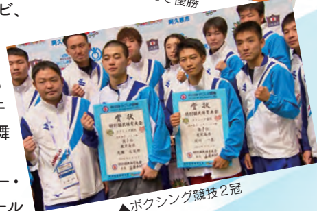
▲ボクシング競技2冠

ラジオは会期中、各会場のおもてなしの様子をラジオカー・ポニー号の生中継でお伝えしました。ソフトボール競技などが開かれた指宿市では地元のボランティアらが特産のかつお節と麦みそに緑茶を注いだ郷土料理「かつお茶ぶし」を振る舞い、馬術競技が行われた霧島市牧園町では鹿児島茶が振る舞われました。この中継の様子はラジオ番組「モーニングスマイル」のSNSで見ることができます。