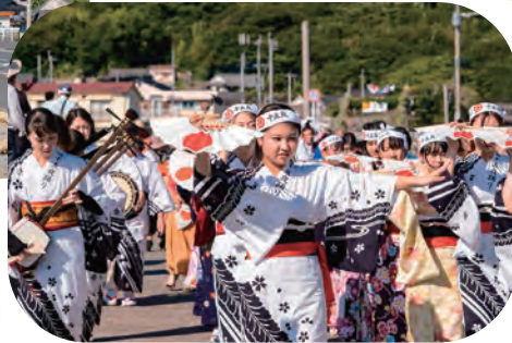
▲九玉神社への宮参り