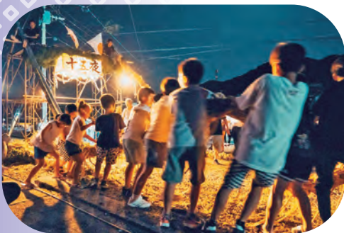
▲集落総出で行われた綱引き

9月30日、泊集落ではぼつかりと浮かんだ満月の月明りのもと、地域の人たちが総出で踊りや綱引きなど伝統の十五夜行事を楽しんでいました。坊津の十五夜行事の様子は、「ダイドーグループ日本の祭り 望月一夜～坊津の十五夜行事～」として10月29日(日)にMBCテレビで放送します。