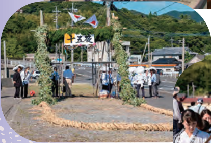
▲十五夜準備が進む

第5弾は、薩摩半島の西南端に位置する歴史と絶景の港町、南さつま市坊津を紹介しました。坊津の各集落では旧暦の8月をむかえると十五夜の準備で活気づきます。それぞれの集落に独自の十五夜行事が受け継がれていて、ふるさとを離れた人も祭りのために帰省するなど正月より賑わい華やかといわれています。